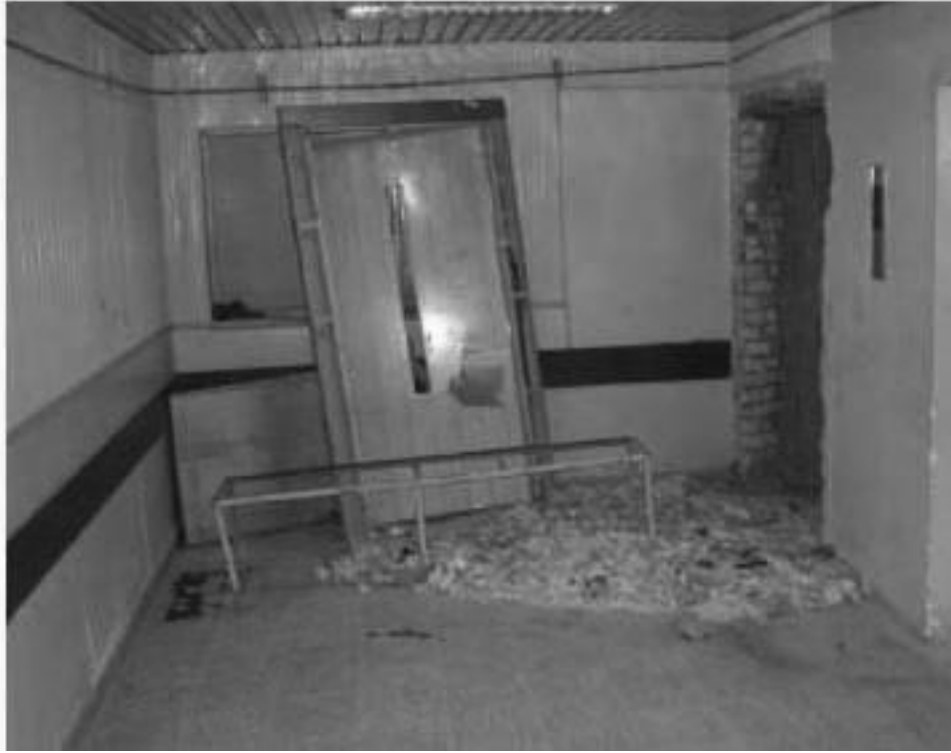
الصورة ١ - مصعد مستشفى الحلة العام

تركيب مصعد جديد. وبما أنه كان قد تمّ تسديد جميع مستحقات المقاول، فلم يتم تحميل المقاول المسؤولية عن متطلبات العقد. قد خسر موظفو منطقة جنوب وسط العراق المال المنفق على تركيب مصاعد جديدة، كما فقد ثلاثة أشخاص أرواحهم.