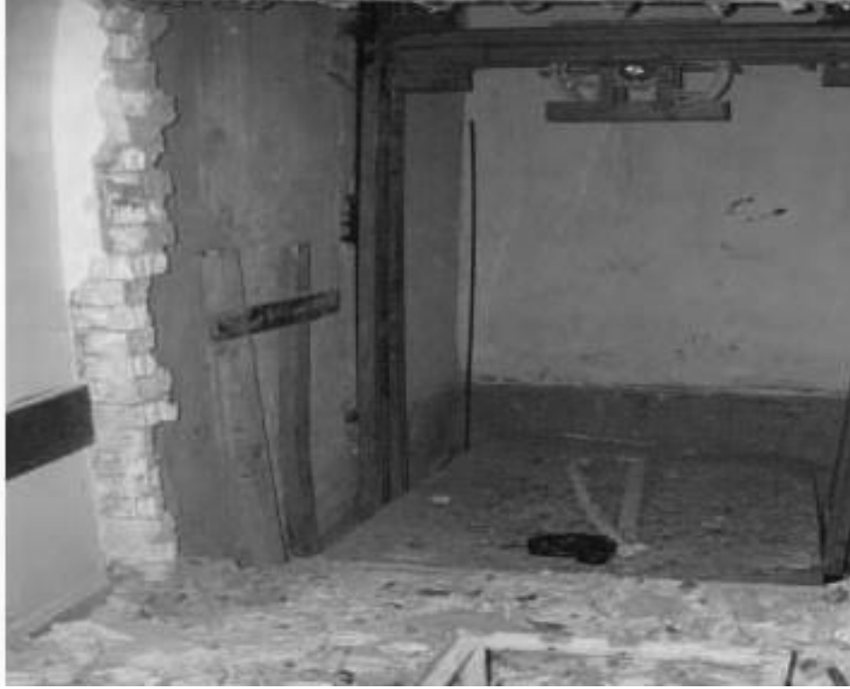
الصورة ٢ - مصعد مستشفى الحلة العام

مسيح الحلة الأولمبي. منح موظفو منطقة جنوب وسط العراق عقداً لترميم مسيح الحلة الأولمبي بتاريخ ٢٢ آذار/مارس ٢٠٠٤، بقيمة بلغت ١٠٨،١٤٠ دولار. وقد تتطلب بيان العمل استبدال كافة المضخات والأنابيب. تم توقيع شهادة الإنجاز بتاريخ ١٦ تموز/يوليو ٢٠٠٤ ونصت على أن "كافة الأعمال قد أنجزت". نصت سجلات منطقة جنوب وسط العراق على أن "هذه القضية تعتبر مغلقة".