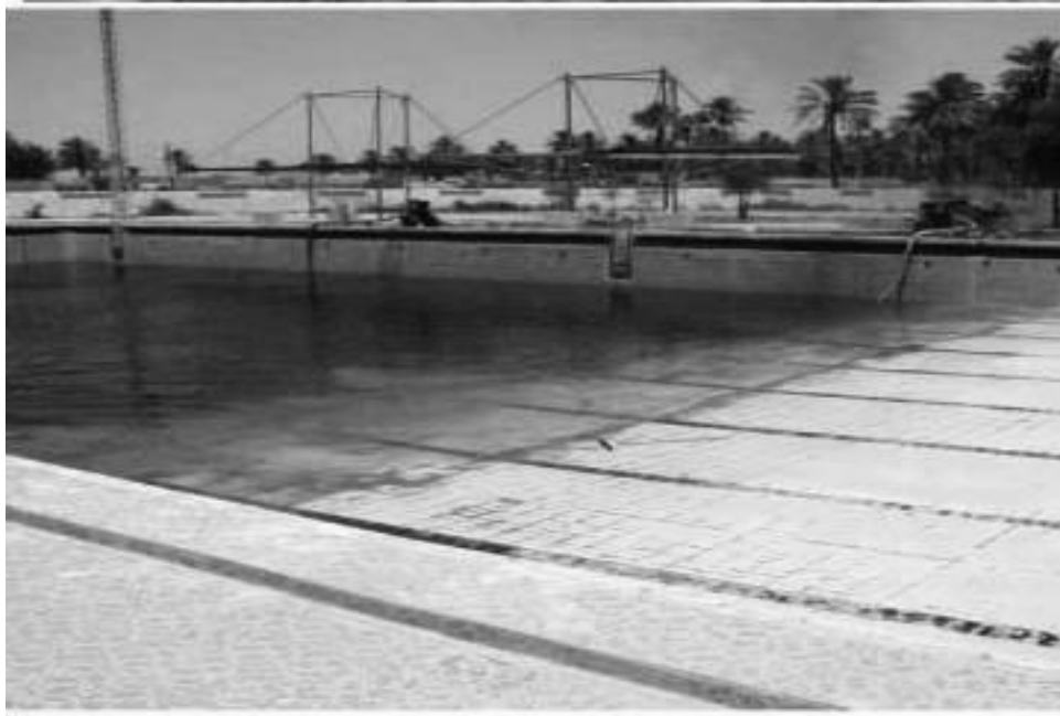
الصورة ٤ - مسبح الحلة الأولمبي