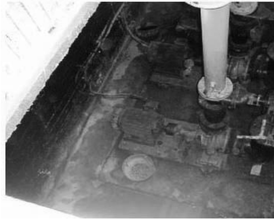
الصورة ٣ - مضخات مسبح الحلة الأولمبي