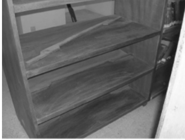
الصورة ٧ - رفوف مصنوعة من خشب مضغوط بدلاً من الخشب الصلب