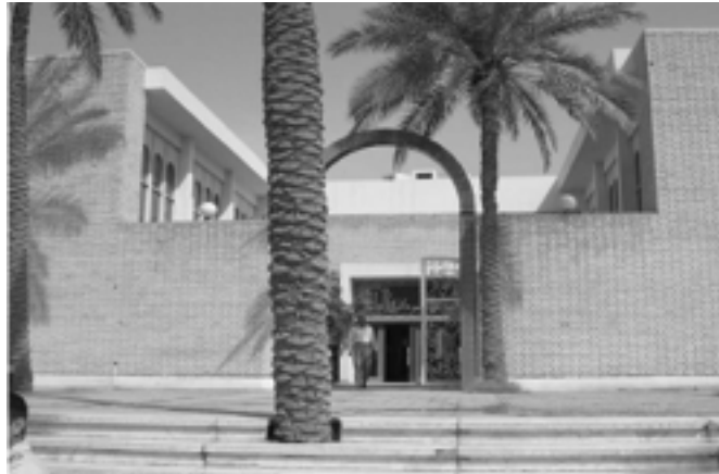
الصورة ٤ - لم يتم نزع الأشجار التي تحيد بالمدخل والموجودة أمامه وإعادة زرعها حسب ما نصت عليه شروط العقد