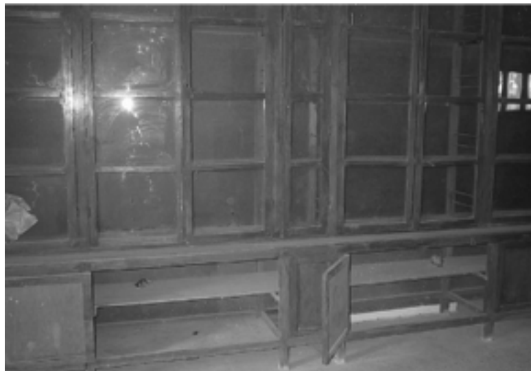
الصورة ٦ - أطر خشبية وزجاجية مستعملة