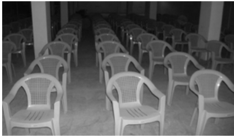
الصورة ٥ - مقاعد بلاستيكية بدلاً من مقاعد معدنية منجدة

وافقنا على الاستنتاج الوارد في تقرير عملية التفتيش التي قام بها فريق الدعم العراقي الأممي لسلاح الهندسة ان المقاول تخلف عن شراء السلع المتفق عليها. لم تكن البنود التي زودها المقاول مطابقة للمقاييس المحددة في نطاق العمل أو كانت مستعملة، أو لم تكن في حالة جيدة. فمثلاً، زود المقاول مقاعد بلاستيكية بدلاً من المقاعد المعدنية المنجدة المطلوبة. انظر الصورة ٥ التي تظهر المقاعد البلاستيكية. بالإضافة إلى ذلك، زود المقاول ثلاثة أطر خشبية وزجاجية من نوعية سيئة للغاية بدلاً من تزويد أطر خشبية وزجاجية جديدة حسب المنصوص عليه في العقد. انظر الصورة ٦ التي تظهر الأطر الخشبية والزجاجية من النوعية السيئة. بالإضافة إلى ذلك، صنعت رفوف الكتب ذات الوجه المزدوج بقياس مترين البالغ عددها ١٣٨ من الخشب المضغوط وليس من الخشب الصلب، كما نصت العقد عليها شروط تحديداً. انظر الصورة ٧ التي تظهر الخشب المضغوط. انظر الملحق "ح" لمعرفة تفاصيل السلع والخدمات التي لم يزودها المقاول فيما يخص الأثاث.