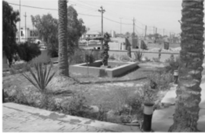
الصورة ٣ - نافورة مياه غير شغالة، نباتات تسوير غير موجودة، وعدد غير صحيح من أنوار الحدائق

المطلوبة بمقدار ١٢ × ٤٠ متراً. بالإضافة إلى ذلك لم يزود المقاول نافورة مياه مجهزة بمضخة شغالة، ولم يزود أية نباتات تسوير، ولم يزود العدد الصحيح من أنوار الحدائق. انظر الصورة ٣ التي تظهر النافورة ونباتات التسوير وأنوار الحدائق. علاوة على ذلك، لم ينزع المقاول الأشجار الثلاث في الجهات الأمامية واليسرى واليمنى من الدرجات وإعادة زرعها. انظر الصورة ٤ التي تظهر الأشجار. انظر الملحق "ح" لمعرفة تفاصيل السلع والخدمات التي لم يزودها المقاول لأعمال هندسة الحدائق.