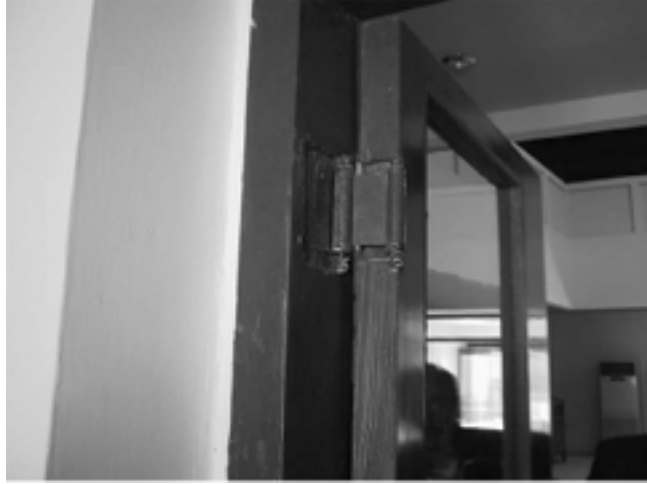
الصورة ١ - تصلّيح غير كامل لمفصلة باب

ترميم الأبنية. وافقنا على الاستنتاج الوارد في تقرير فريق الدعم العراقي الأمامي لسلح الهندسة أن المقاول تحلف عن التنفيذ وفقاً لنطاق العمل المحدد. لم يزود المقاول بنوداً عديدة كالمراوح السقفية، والألواح الزجاجية، ومانعات التسرب حول النوافذ. بالإضافة إلى ذلك، لم ينفذ المقاول تصلّيات جيدة النوعية للأبنية. انظر الصورتين ١ و ٢ اللتين تظهران العمل الفني السيئ لبعض التصلّيات وأنظر الملحق "ح" لمعرفة تفاصيل السلع والخدمات التي لم يزودها المقاول لتصلّيح الأبنية.