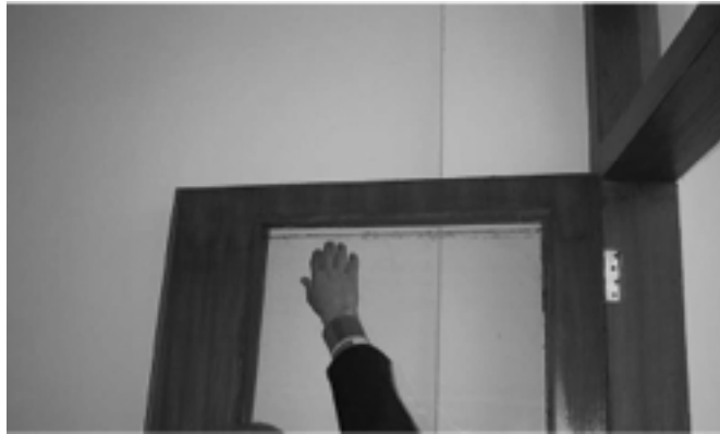
الصورة ٢ - لوح باب زجاجي بحجم غير ملائم

هندسة الحدائق: وافقنا على الاستنتاج الوارد في تقرير عملية التفتيش التي قام بها فريق الدعم العراقي الأمامي لسلح الهندسة أن المقاول تخلف عن التنفيذ وفقاً لنطاق العمل المحدد. حدّد استدراج عروض الأسعار إنشاء منطقة مبلطة لإيقاف السيارات بمساحة ٢٤ × ٧٥ متراً. وبدلاً من ذلك، زود المقاول منطقة مبلطة لإيقاف السيارات بمساحة ٣٠ × ٣٥ متراً مخفضاً مساحة موقف السيارات