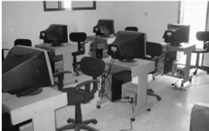
الصورة ٨ - كمبيوترات شخصية قائمة بذاتها

نوافق على الاستنتاج الوارد في تقرير عملية التفتيش التي قام بها فريق الدعم الأمامي لسلح الهندسة بأن المقاول تخلف عن تسليم وتركيب أنظمة خدمات الإنترنت. لم يزود المقاول ٥٤ كمبيوتراً شخصياً من ال ٦٨ كمبيوتراً شخصياً المطلوبين، وتخلف عن تزويد المعدات والبرامج اللازمة لتركيب أنظمة خدمة الإنترنت. تفحصنا حجرة الكمبيوترات في المكتبة ووجدنا ان الكمبيوترات الشخصية المزودة من قبل المقاول كانت تعمل كأجهزة كمبيوتر قائمة بذاتها بدون وصل بجهاز كمبيوتر خادم حسب ما نص عليه العقد. لم نعثر على أي دليل يؤكد بأنه تم تركيب أي أسلاك صلبة أو انه تم تركيب أي وسائل للوصل بين الكمبيوترات والجهاز الخادم. أنظر الصورة ٨ التي تظهر الكمبيوترات الشخصية القائمة بذاتها وانظر الملحق "ط" لمعرفة تفاصيل السلع والخدمات التي لم يزودها المقاول فيما يخص خدمات الإنترنت.