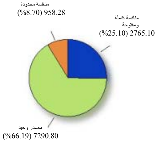
أنواع التنافس حسب قيمة العقود الكبرى الصادرة خلال السنة المالية 2003